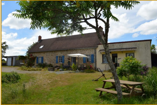
maison + gite 1